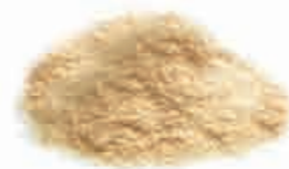
Segatura di legno Sciures de bois