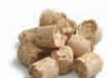
Bricchette di legno Briquettes de bois