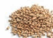
Pellet di legno Granulés de bois